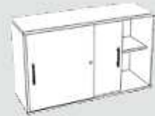
Schiebtürenschränk 2 OH 120 x 40 x 74,8 cm (B x T x H)