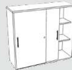
Schiebtürenschränk 3 OH 120 x 40 x 110 cm (B x T x H)